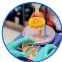
B+R in-house research