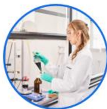
cCRO chemical Contract Research Organization